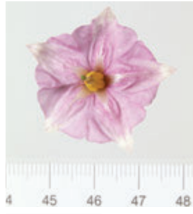
Foto6: Flor de la papa Negra Yema de Huevo