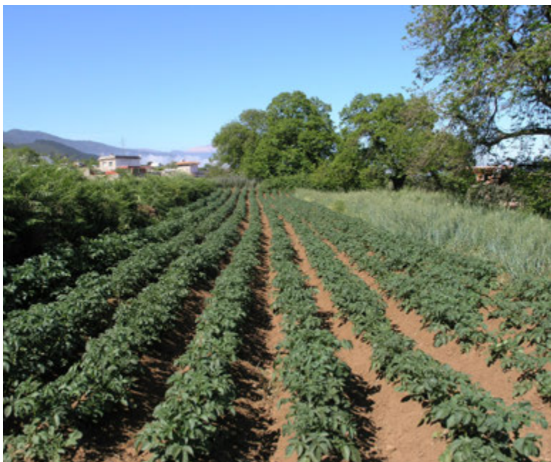
Foto4: Cultivos de papas y cereales asociados en Tenerife