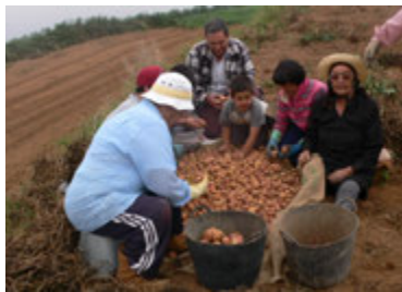
Foto14: Seleccionando la papa para la semilla.