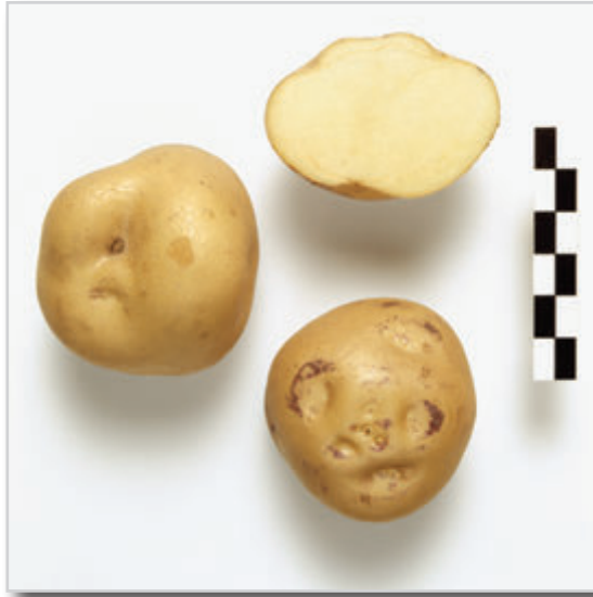
Foto20: Papa Azucena Blanca.