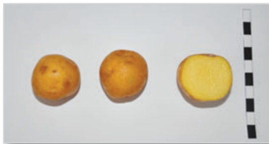
Foto36: DE MARIA