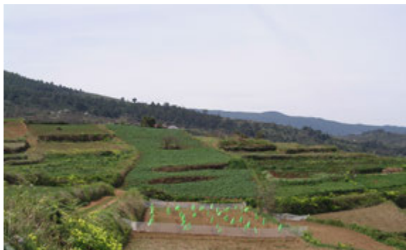
Foto13: Cultivo de papas y cereales en Icod el Alto.