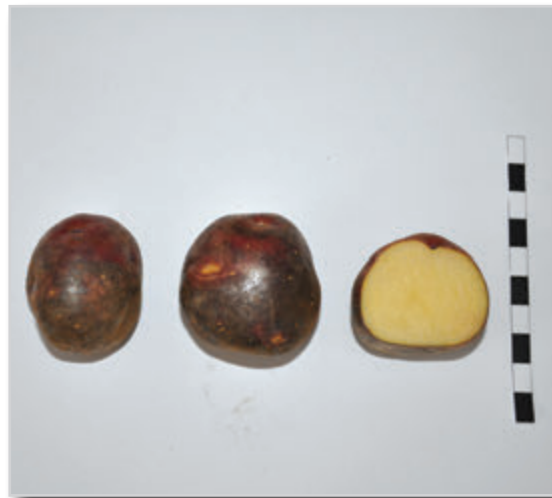
Foto43: NEGRITA (Cultivada en el Hierro y similar a la Tormenta o Tormenta que se cultiva en Tenerife)