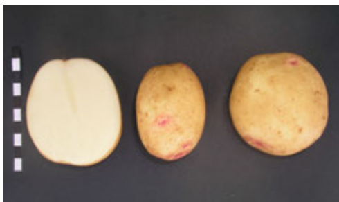
Foto2: Variedad Comercial Cara