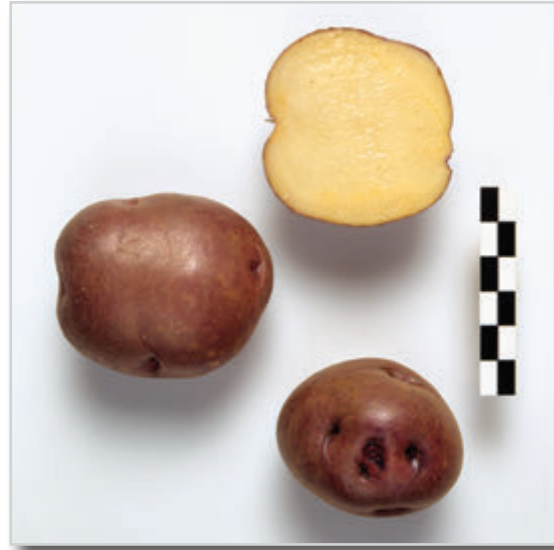
Foto29: Papa Peluca Negra.

Similar a la anterior, pues pertenece al mismo grupo, varía fundamentalmente en el color de la piel del tubérculo que es morado rojizo muy oscuro con muy pocas manchas anaranjadas. Los “grelos” son morados oscuros con el ápice blanco. Tiene las mismas características de postcocecha que la Peluca Blanca. Existe una Peluca intermedia entre la Peluca Blanca y la Peluca Negra, que es la conocida como Peluca Rosada.