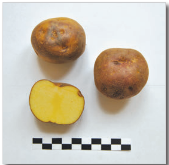
Foto31: Papa Venezuela Negra.

Tubérculos redondos de color morado rojizo en su totalidad con un ligero salpicado marrón, o como anteojos alrededor de los ojos de la papa. La piel es de tacto suave, hecho este que puede servir para diferenciarla en algunas ocasiones de la Azucena Negra. Los ojos son superficiales, con los grelos de color blanco, con pocas manchas de color violeta a lo largo del mismo. Es una papa de introducción no muy antigua, probablemente de la zona productora de Mérida en Venezuela, pero es muy valorada por su gran rusticidad durante el cultivo, su buena productividad y porque no se deshace al cocinarla. Se usa mucho para hacer las famosas papas con costillas.