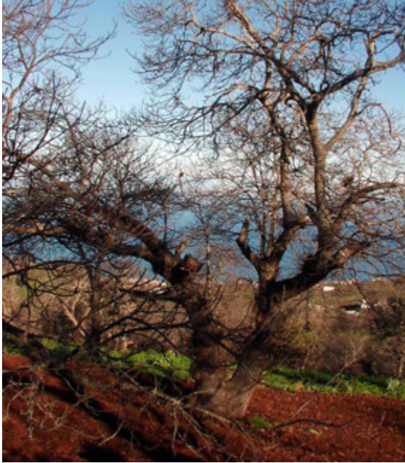
Foto11: Huerta con castaño preparada para sembrar papa.

○ La zona Central , donde se ubican las grandes superficies productoras de papa del entorno de Benijos, Palo Blanco y Las Llanadas. Quizás sea, junto con la de Icod el Alto, la zona cuantitativamente más importante en la producción de papas antiguas. Principalmente se cultivan el grupo de las Bonitas, siguiéndole las Coloradas y Venezolanas. En esta zona los agricultores viven principalmente del cultivo de la papa, conviviendo variedades tradicionales con grandes extensiones de papas comerciales, fundamentalmente Cara y Red Cara, aunque en los últimos años han aparecido variedades nuevas como la Druid, Valor, Slaney, Rooster, etc.