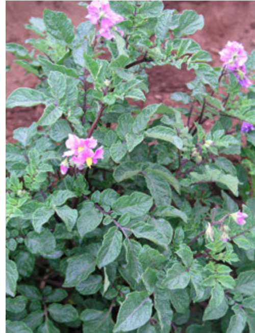
Foto7: Planta de la variedad Colorada de Baga