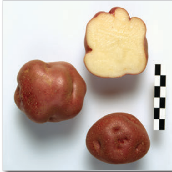
Foto26: Papa Colorada de Baga.