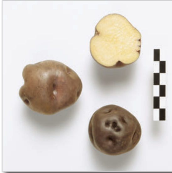
Foto22: Papa Bonita Negra.