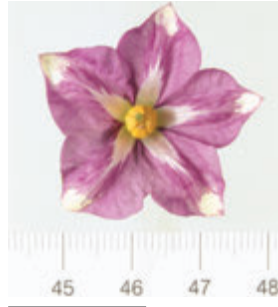
Foto5: Flor de la papa Azucena Blanca

Las papas no son el fruto de la planta, son tallos subterráneos engrosados por la acumulación de almidón que tienen la capacidad de producir nuevas plantas. Esto explica el que se verdeen al exponerlos a la luz como lo hacen los tallos de cualquier planta.