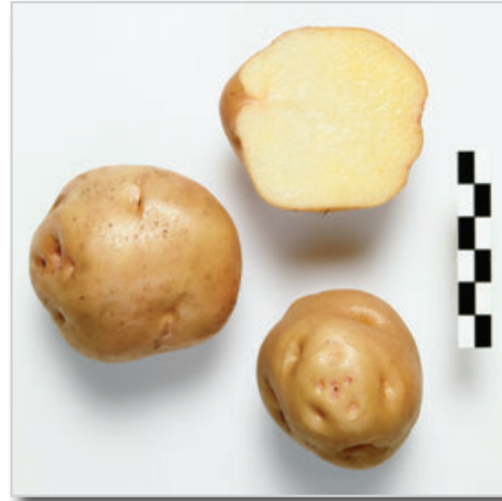
Foto25: Papa Borralla o Melonera.

Los tubérculos de esta variedad son oblongos si se mira en una posición y aplanados si se mira por el otro, siendo redondos cuando las papas son pequeñas. Los ojos son ligeramente profundos, con la carne amarilla y los grelos de color rosado con pocas manchas a lo largo y en el ápice. El color de la piel es marrón claro con ligeros tonos anaranjados, y ligeramente salpicado de rosado, sobre todo en la zona de los ojos. Es una papa con un periodo hasta la brotación largo, y con alto contenido en materia seca, de tal manera que dicen que cuando se come con un guiso de carne o en salmorejo se “chupa” toda la salsa. Se le conoce como Borralla en Anaga y Melonera en Teno. Existe una variante conocida como Borralla Rosada.