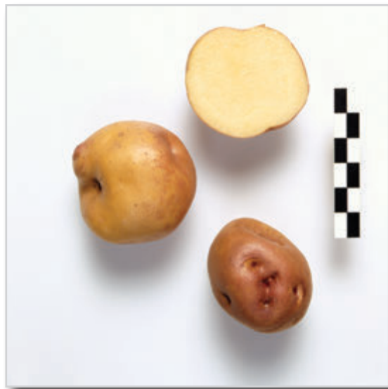
Foto28: Papa Peluca Blanca.