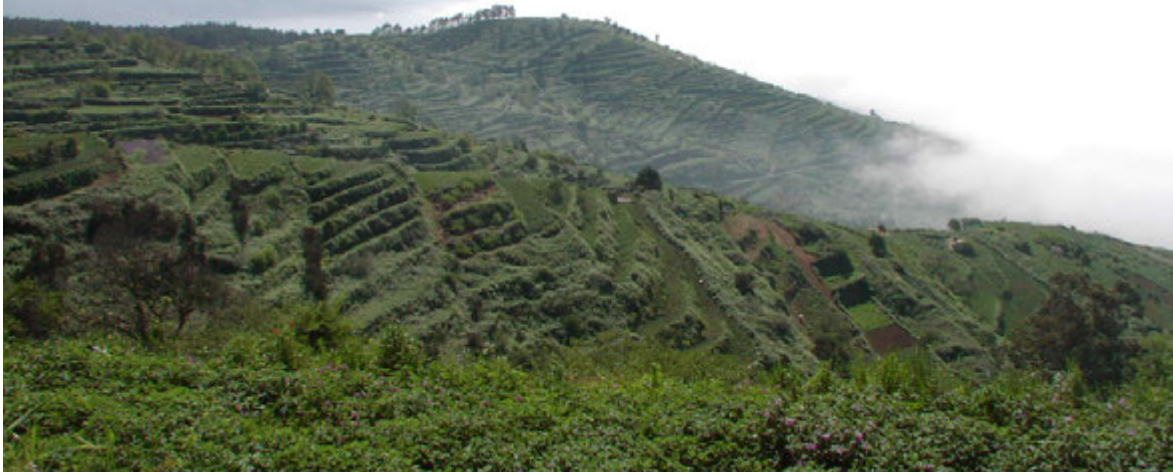
Foto16: Cultivo en bancales en el norte de Tenerife.

■ Otras zonas dispersas: Existen diversos reductos aislados donde se cultivan papas en Tenerife, y que sería muy difícil de enumerar sin olvidar alguno. Pero casi podríamos decir que cada municipio tinerfeño tiene su tradición papera. Valga como ejemplo la im-