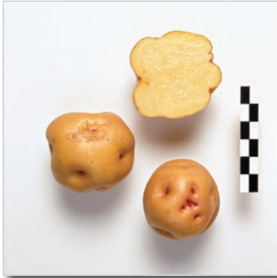
Foto24: Papa Bonita Ojo de Perdiz.