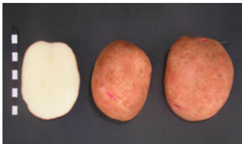
Foto3: Variedad Comercial Druid