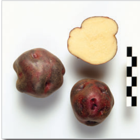
Foto30: Papa Torrenta o Terrenta.