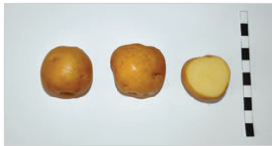
Foto39: DEL RIÑÓN