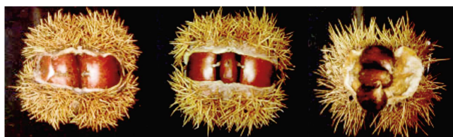
Corta Media Larga