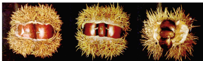
Corta Media Larga