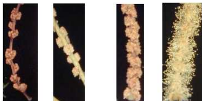
Astaminado Braquistaminado Mesostaminado Longuistaminado