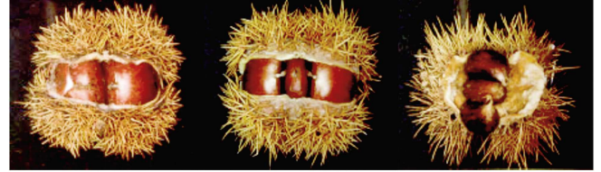
Corta Media Larga