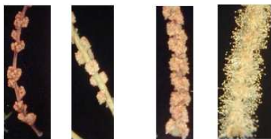
Astaminado Braquistaminado Mesostaminado Longuistaminado