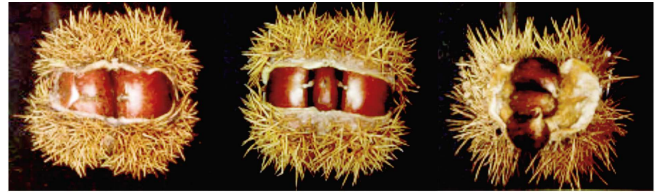
Corta Media Larga