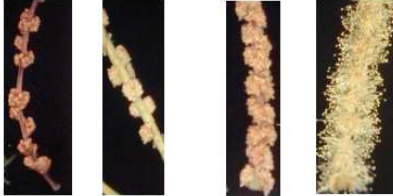
Astaminado Braquistaminado Mesostaminado Longuistaminado